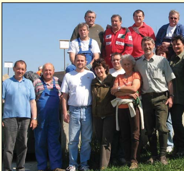
Der Obstbauverein hofft auch heuer wiederum auf eine große Teilnehmerzahl an der Flurreinigung.