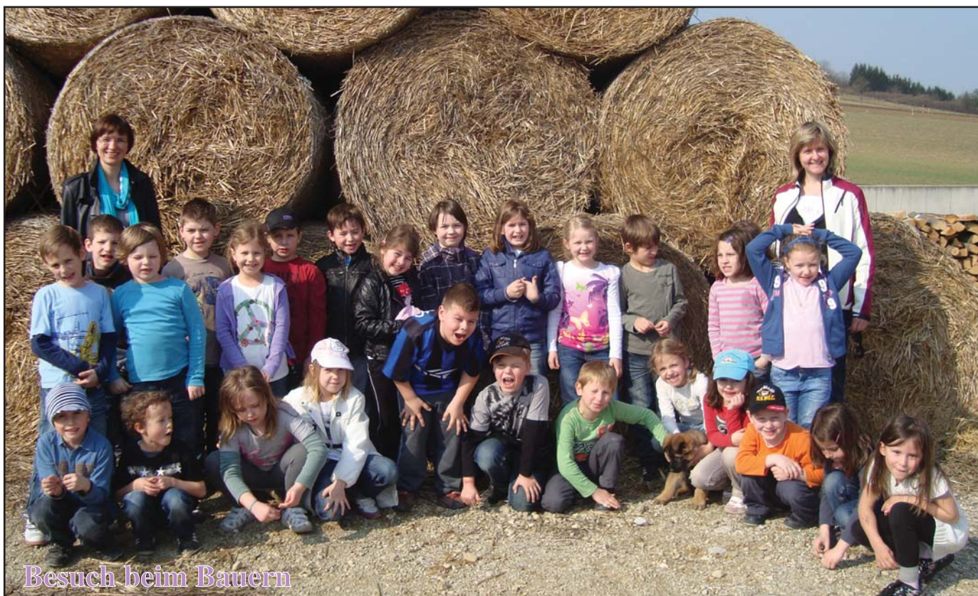
Besuch beim Bauern

Ortsplan mit Wanderkarte im Blattinneren